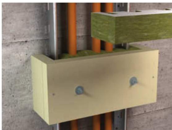
Lehké žebříky LG 60 s odlehčením tahu ZSE90

Svazky kabelů budou na žebříku uchycovány pomocí třmenových úchytek. V jedné úchytky max. 3 kabely. Ve svislé trase jejíž délka bude bez přerušení požární ucpávkou delší než 3,5m bude v každém patře instalováno uvolnění v tahu ZSE90.